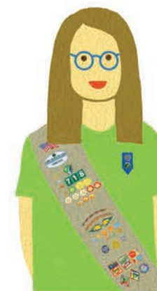
Seniors Grades 9-10