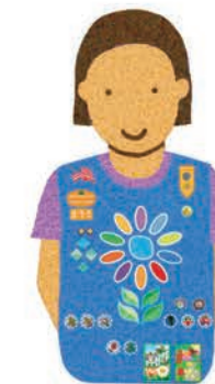
Daisies Grades K-1

Una Juliette o Girl Scout miembro individual, tiene la misma experiencia que las Girl Scouts que son parte de una tropa. Si usted es una familia Juliette, conéctese con su concilio para recibir apoyo y estar al día de los emocionantes eventos para toda la familia.