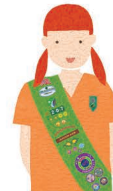
Juniors Grades 4-5