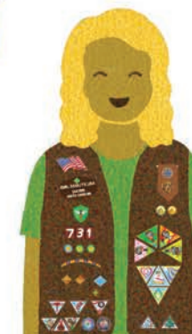
Brownies Grades 2-3