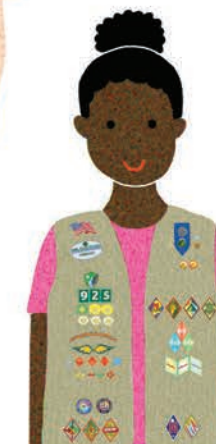
Cadettes Grades 6-8