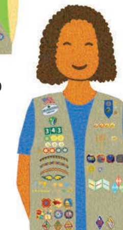
Ambassadors Grades 11-12